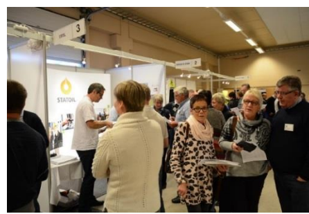
... og mange utstillere i den lille hallen.