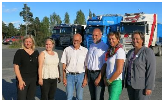
Blide Opplandspolitikere før møtet på Biri.