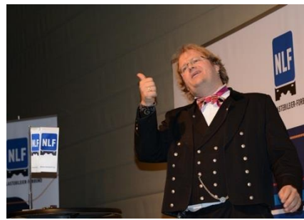
Medhus-guten - rappkjefta halling som fikk fram latteren på høstseminaret!