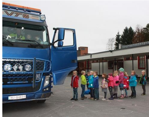
Elevene ved Disenå skole i kø foran førerhytta.