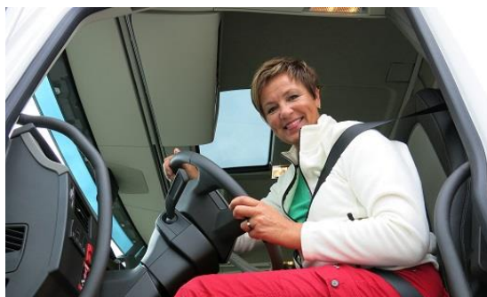
Anne Tingelstad Wøien på nyttig lastebil dag.

Det sa stortingsrepresentant Anne Tingelstad Wøien etter et bedriftsbesøk hos Gran Taralrud AS i august. Senterparti-politikeren fikk en lærerik dag og oppfattet at rekruttering er en av hovedutfordringene i transport-Norge! Hun fikk også beskjed om at vegnettet i Norge er for dårlig. Utbyggingen blir klattvis og delt.