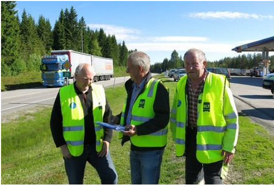
Velten, Langdalen og Grøtting teller i Hernes.

Tallene fra Hedmark og Oppland samsvarte med de nasjonale resultatene. Resultatet er viktig i arbeidet med å bedre rammevilkårene i næringen. Tellingen ble brukt aktivt i valgkampen.