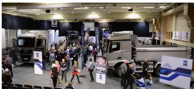
Flott utstilling med store biler på Storefjell....

Fra høsten 2013 er kravet fem millimeters mønsterdybde på alle dekk, samt M+S-merking på styrehjul og drivhjul. NLF har krevd at dette skal følges opp med flere kontroller – spesielt ved riksgrensen. Statens Vegvesen og politiet har etter påtrykk fra regjeringen økt kontrollene. Det har ført til at mange utenlandske vogntog har fått kjøreforbud for dårlige dekk eller mangel på kjetting. Dessverre er det også norske lastebiler med for dårlig utstyr. Det er viktig at vi overholder de nye dekkreglene.