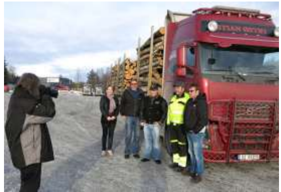
Det nye styret i Odal i Glåmdalens fotolinse.

Østlendingen (17), NRK Hedmark og Oppland (10), GD (9), HA (13), NRK Østnytt (3), Glåmdalen (4), OA (5), Ringsaker Blad (2), TV2.no (1), NRK Dagsrevyen (2), Aftenposten (1), NRK P2 (2), Drammens Tidende (1), Valdres (1), Arbeidets Rett (3), Hamar Dagblad (1), Romerike Blad (1), Transportmagasinet (1) og Yrkesbil (1).