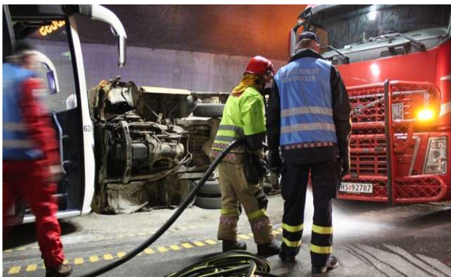
NLF hjalp til under øvelsen i Øyertunnelen.