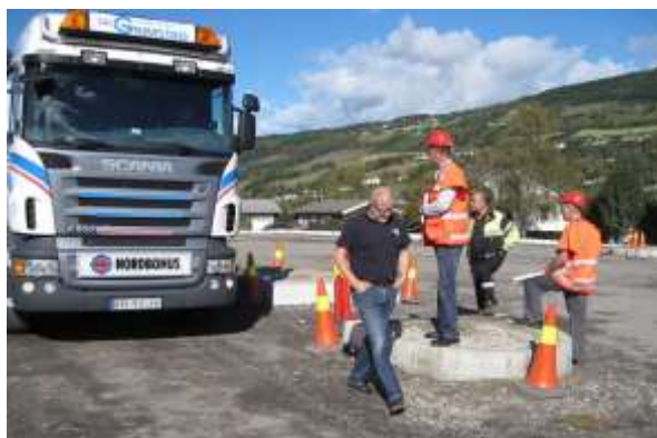
Linflåkrysset i Gausdal ble endret etter NLFs befarig.