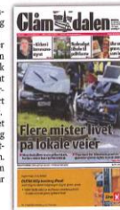
Glåmsdalen 31. oktober 2012.

Han ble ristet til å komme seg bak rattet igjen så fort som mulig, og det gjorde han. Veldig fort.