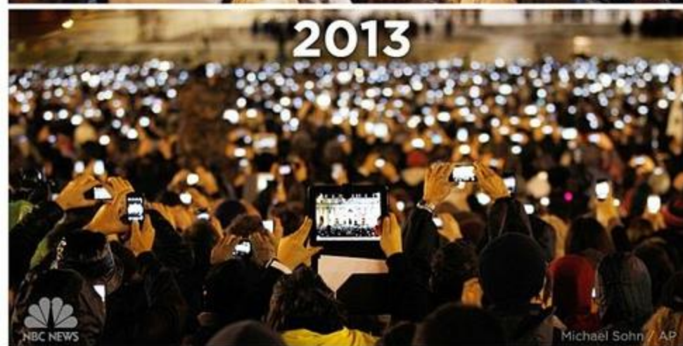
What a difference 8 years makes. St. Peter's Square in 2005 vs. 2013. #NBCPope